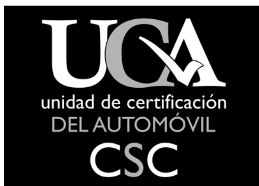
III. Logotipo en blanco y negro –fondo negro